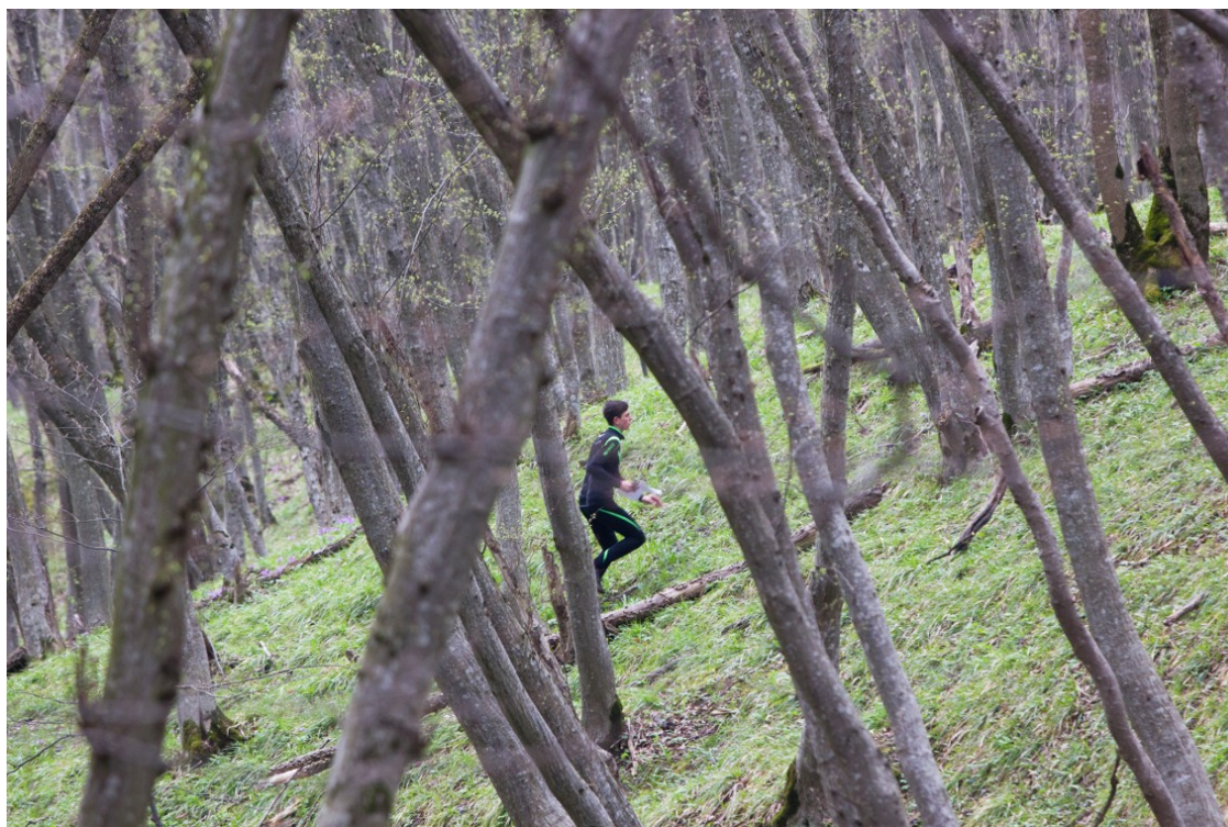
Так выглядит лесной массив «Таманская дача» в начале апреля.