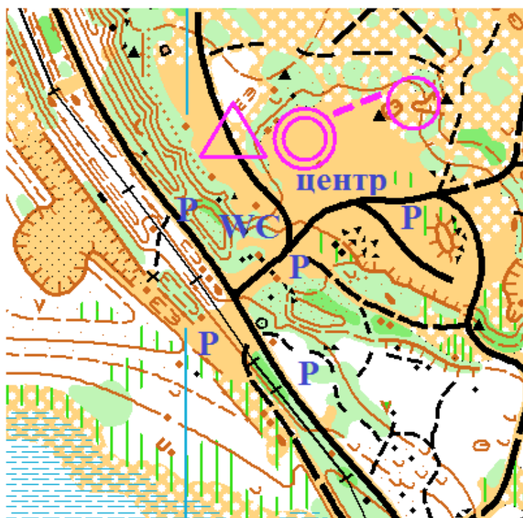
Схема центра старта.